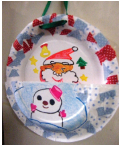
昨年のプレゼント

今年もクリスマスの季節が来ます。今年はどうのような子どもたちの姿が見られるかとても楽しみです。