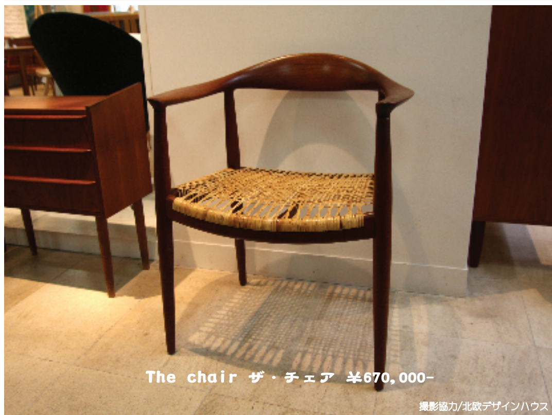
The chair ザ・チェア ¥670,000-